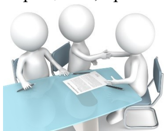
ГРАФИК ПРИЁМА ГРАЖДАН ПО ЛИЧНЫМ ВОПРОСАМ

Должностные лица осуществляют в пределах своей компетенции контроль за соблюдением порядка рассмотрения обращений, анализируют содержание поступающих обращений, принимают меры по своевременному выявлению и устранению причин.